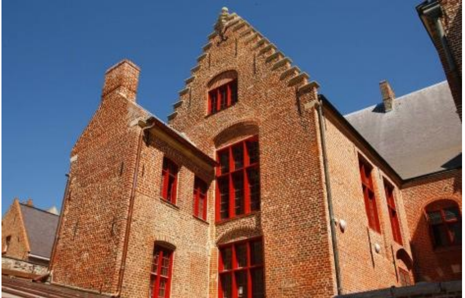
Vue de la façade arrière du musée de Flandre

Perché en haut du Mont Cassel, le musée départemental de Flandre a pour ambition de montrer l'extraordinaire inventivité des artistes flamands.