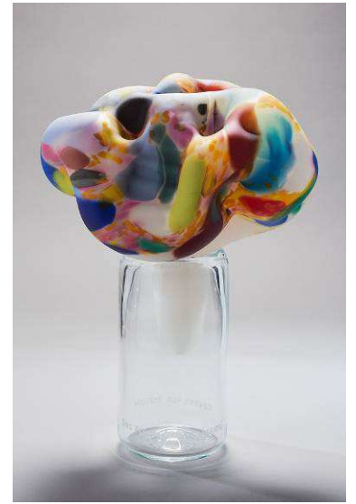
Marvin Lypovsky, Des fleurs pour la liberté

Cette activité peut être proposée dans votre établissement.