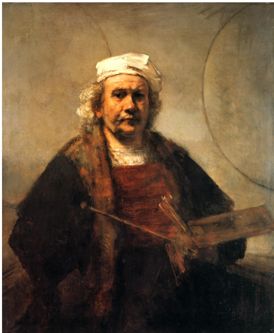
Rembrandt Harmenszoon Van Rijn, dit Rembrandt (1606-1669) Autoportrait , vers 1661 Huile sur toile English Heritage, Kenwood House, Londres