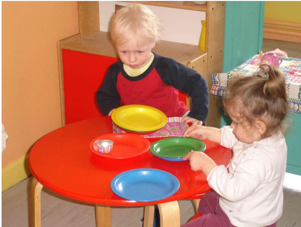
« On y apprend à jouer avec d'autres enfants ».