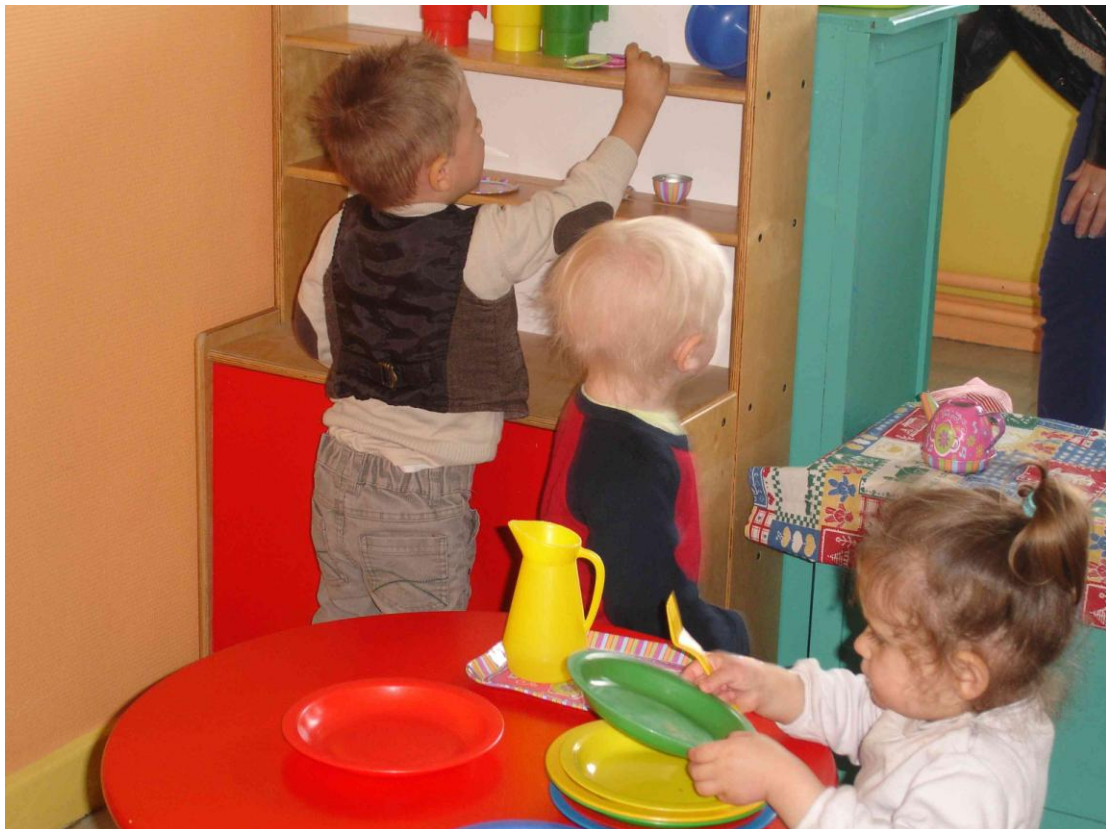
« On y apprend à ranger le matériel... »