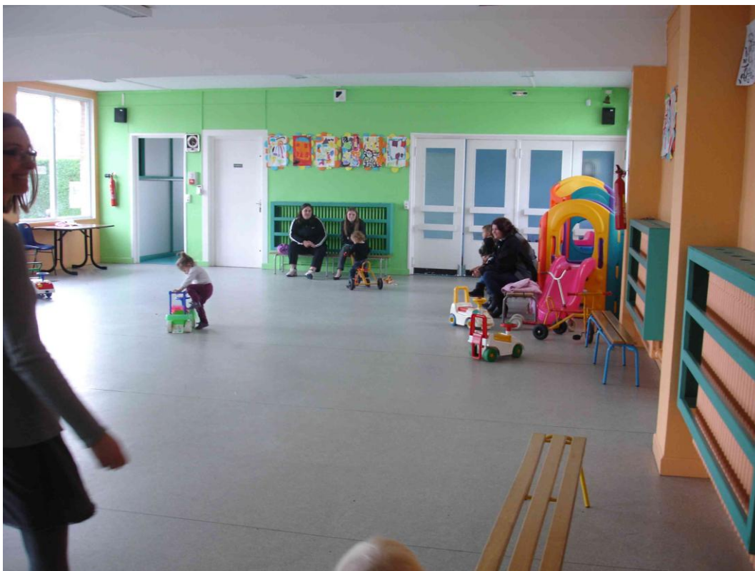
« On retrouve ensuite les mamans »