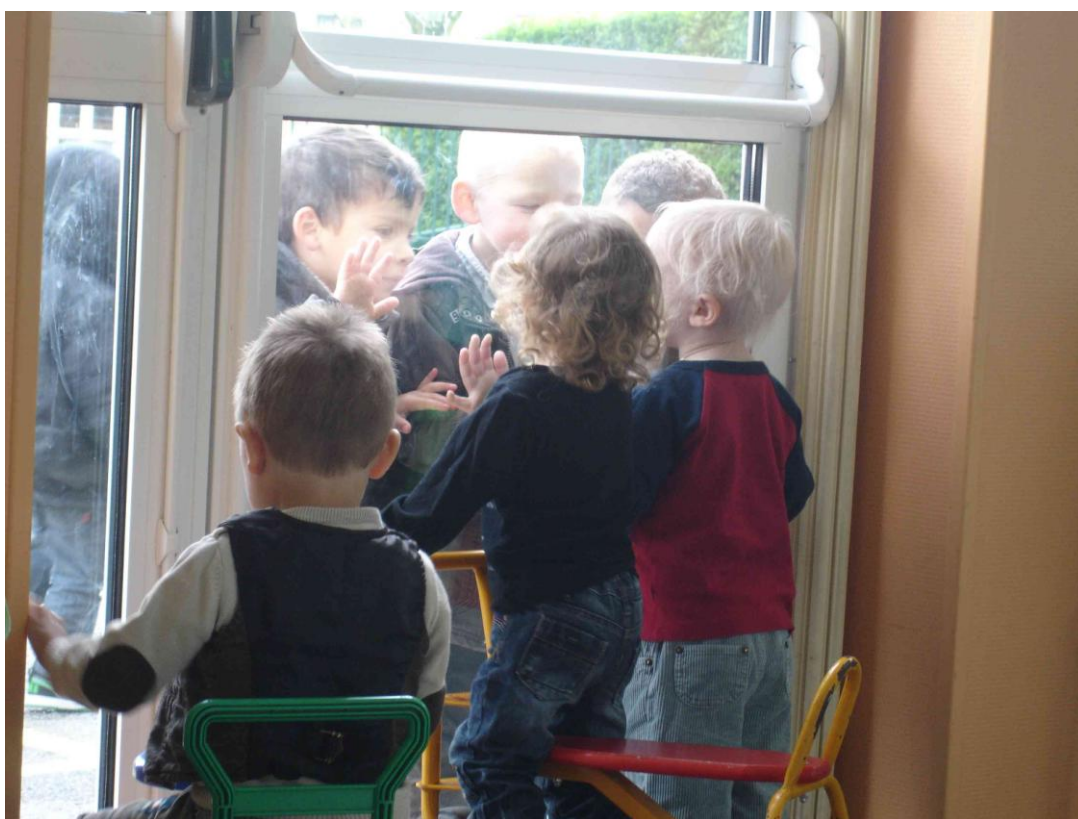
« Premiers échanges avec les élèves de l'école maternelle... »