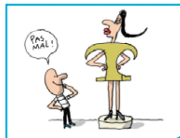
Les coulisses de la mode