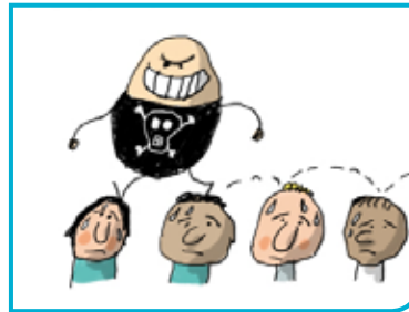
Le virus Ebola