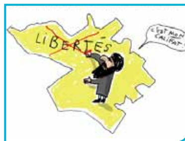
Le califat islamique